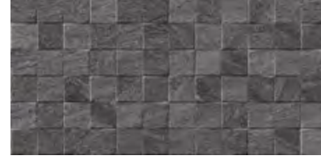
FALCON RELIEVE ANTRACITA