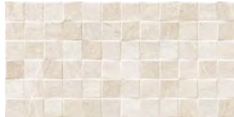
FALCON RELIEVE BEIGE