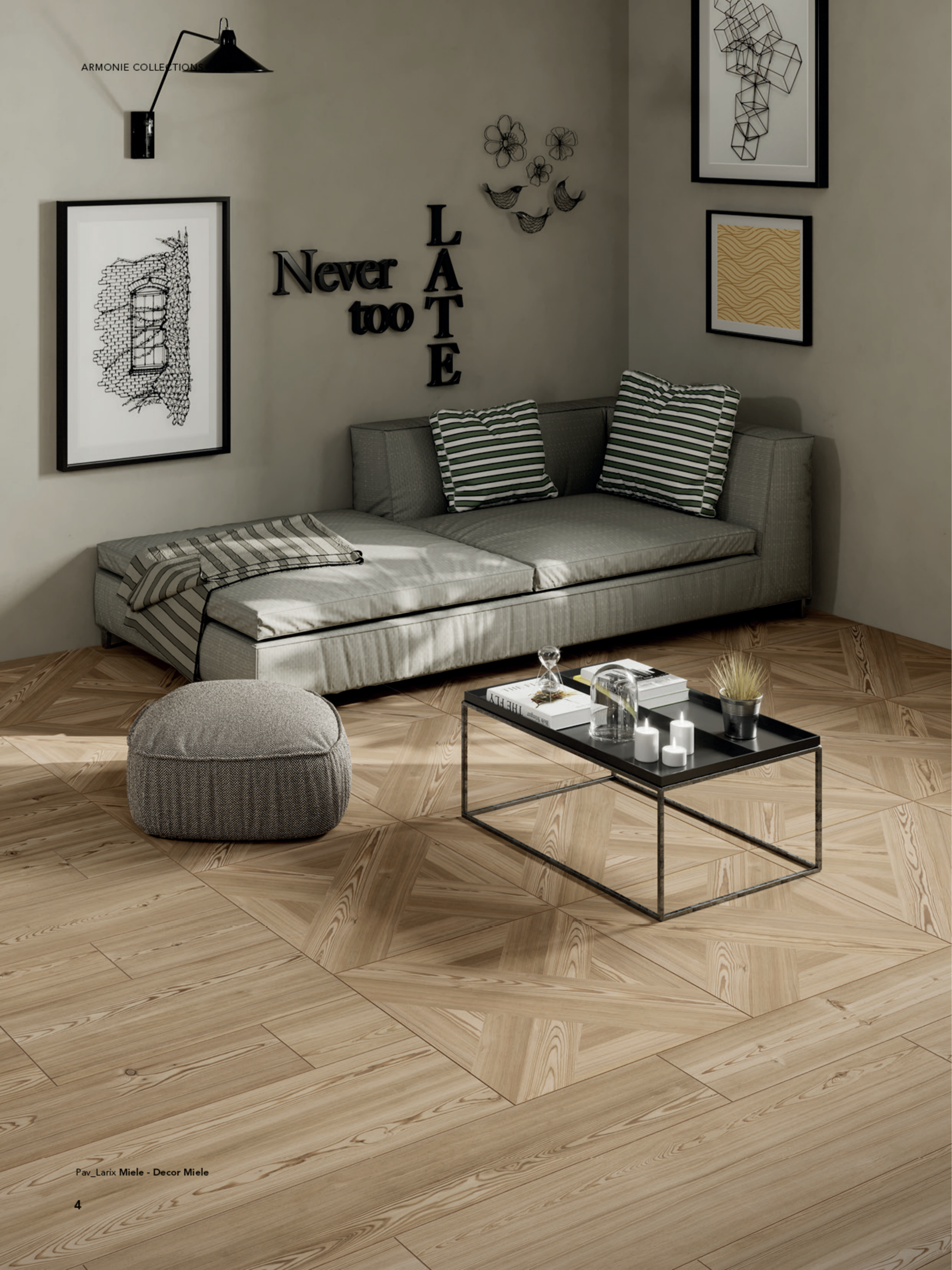
Pav_Larix Miele - Decor Miele