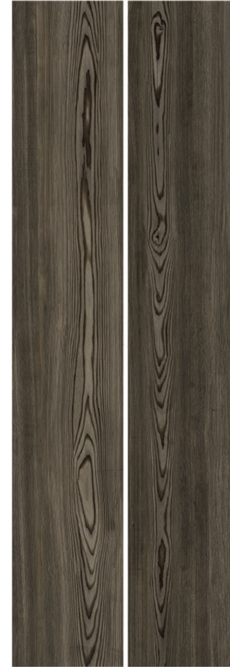
TABACCO 0424008 30x120 0424004 20x120