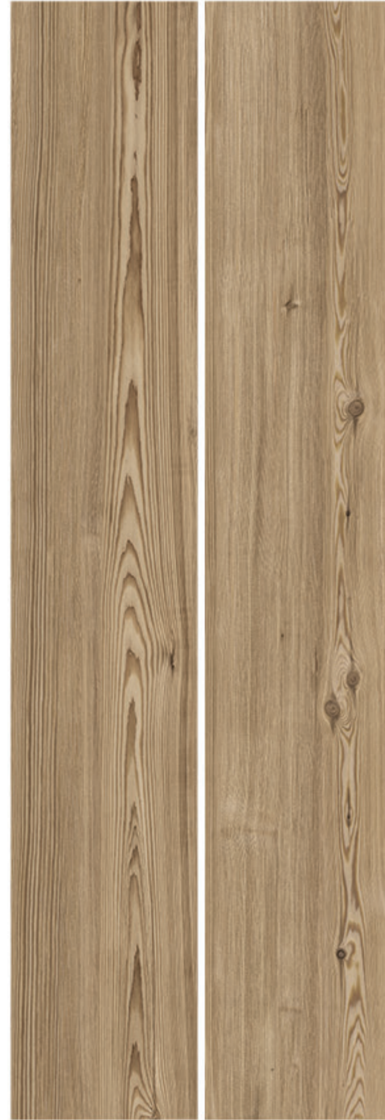
MIELE 0424006 30x120 0424002 20x120