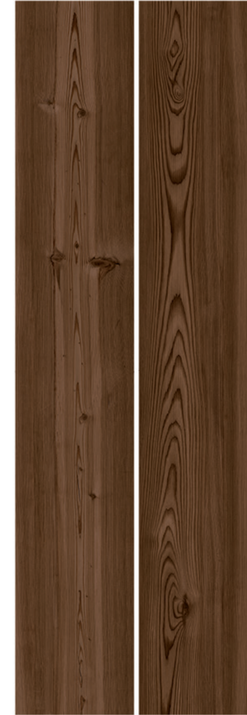
CHERRY 0424014 30x120 0424013 20x120