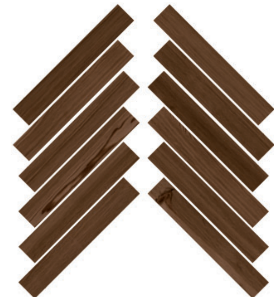
0424038 MOSAICO HERRINGBONE CHERRY 28x59

Inscatolati a coppie dx e sx / One box contains 2 pieces (right and left)