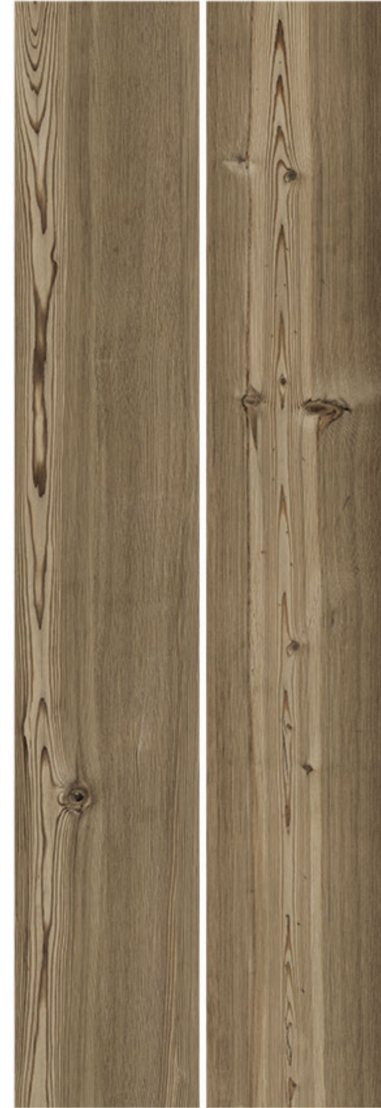
NOCCIOLA 0424007 30x120 0424003 20x120