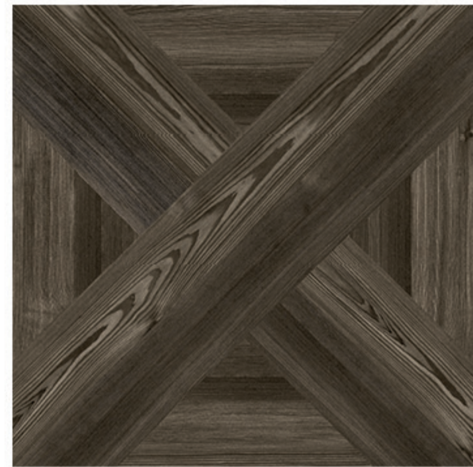
0424012 DECOR TABACCO 1/2/3/4 60x60