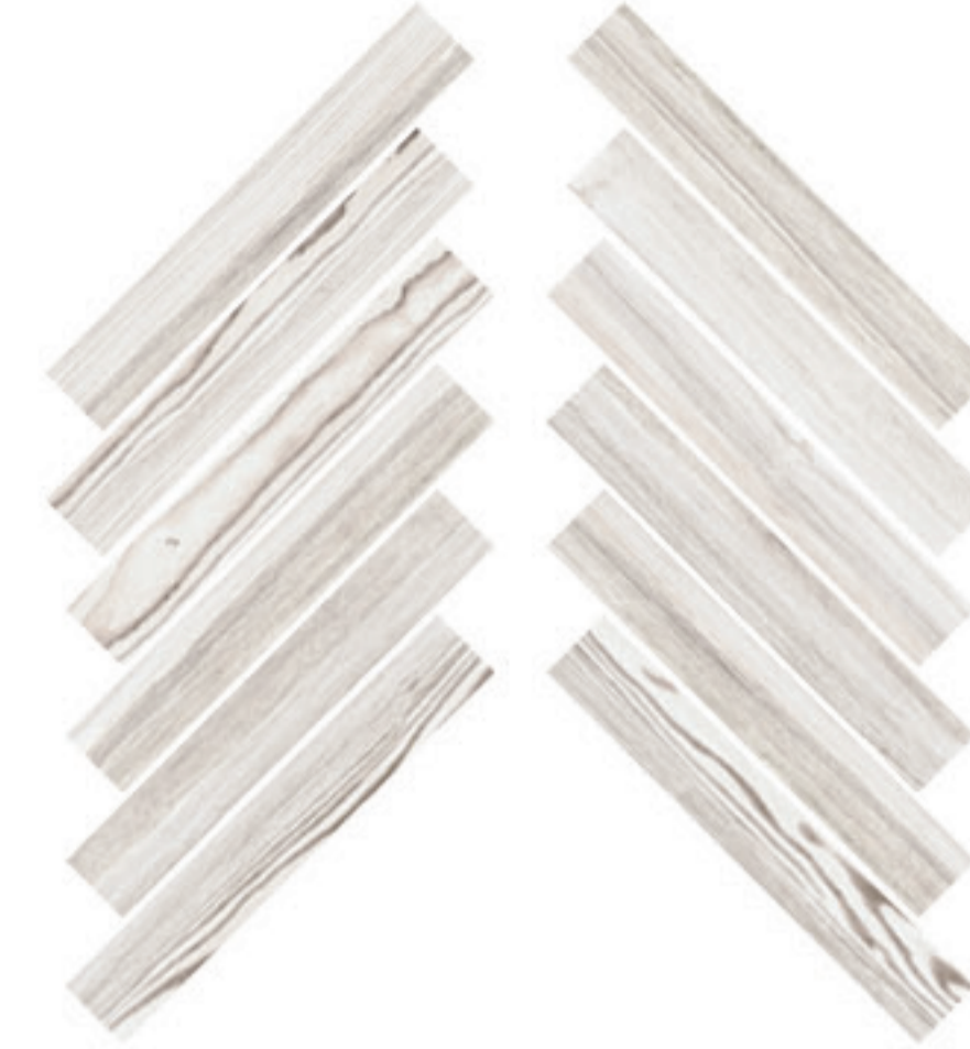
0424020 MOSAICO HERRINGBONE MANDORLA 28x59