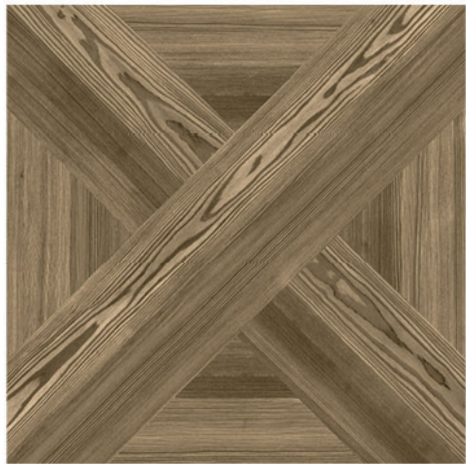
0424011 DECOR NOCCIOLA 1/2/3/4 60x60