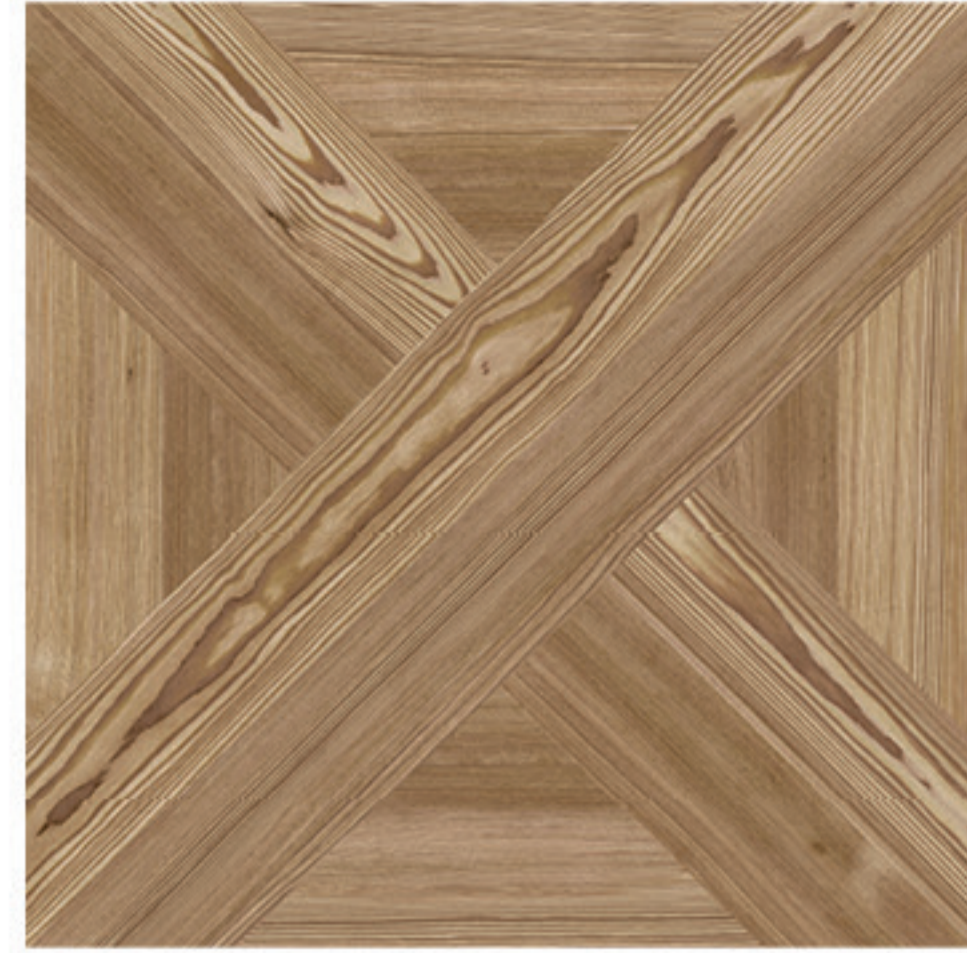
0424010 DECOR MIELE 1/2/3/4 60x60