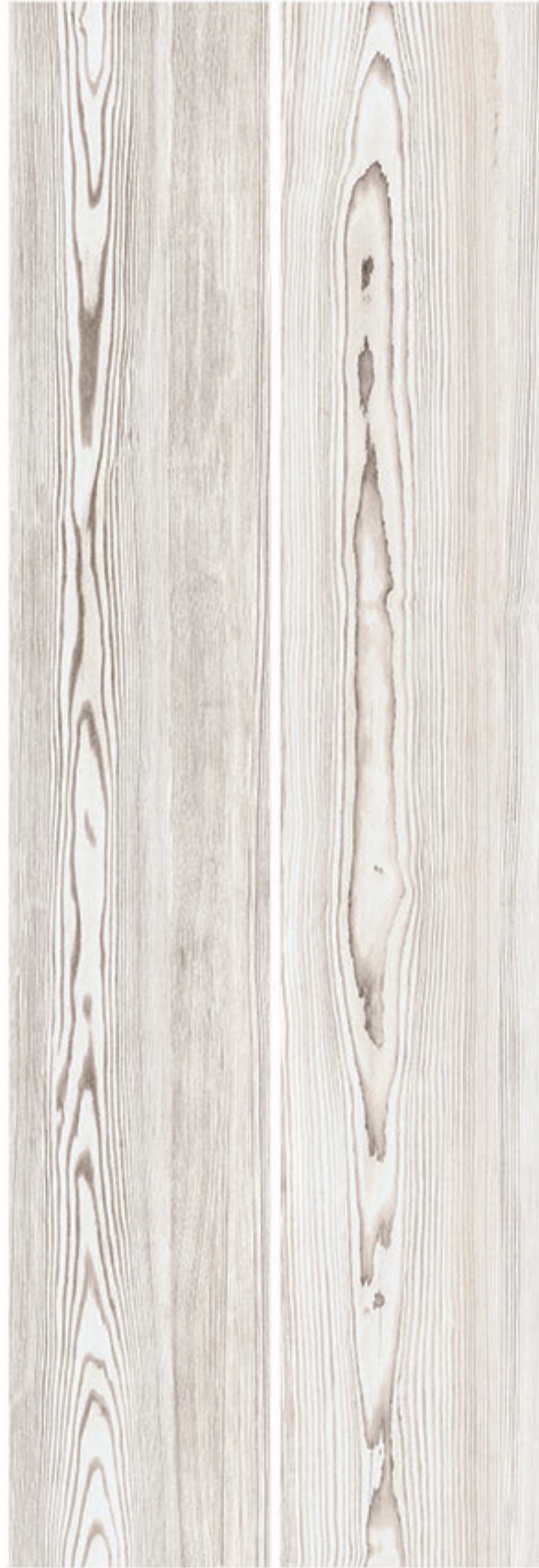
MANDORLA 0424005 30x120 0424001 20x120