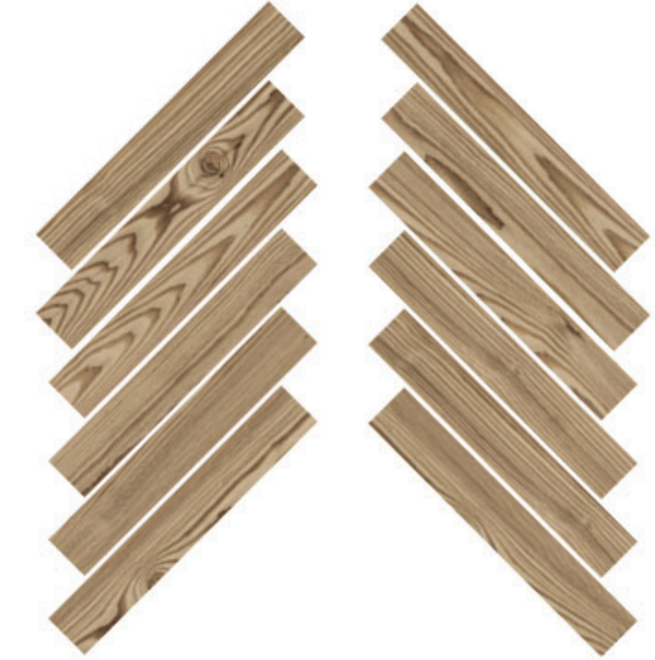
0424019 MOSAICO HERRINGBONE MIELE 28x59