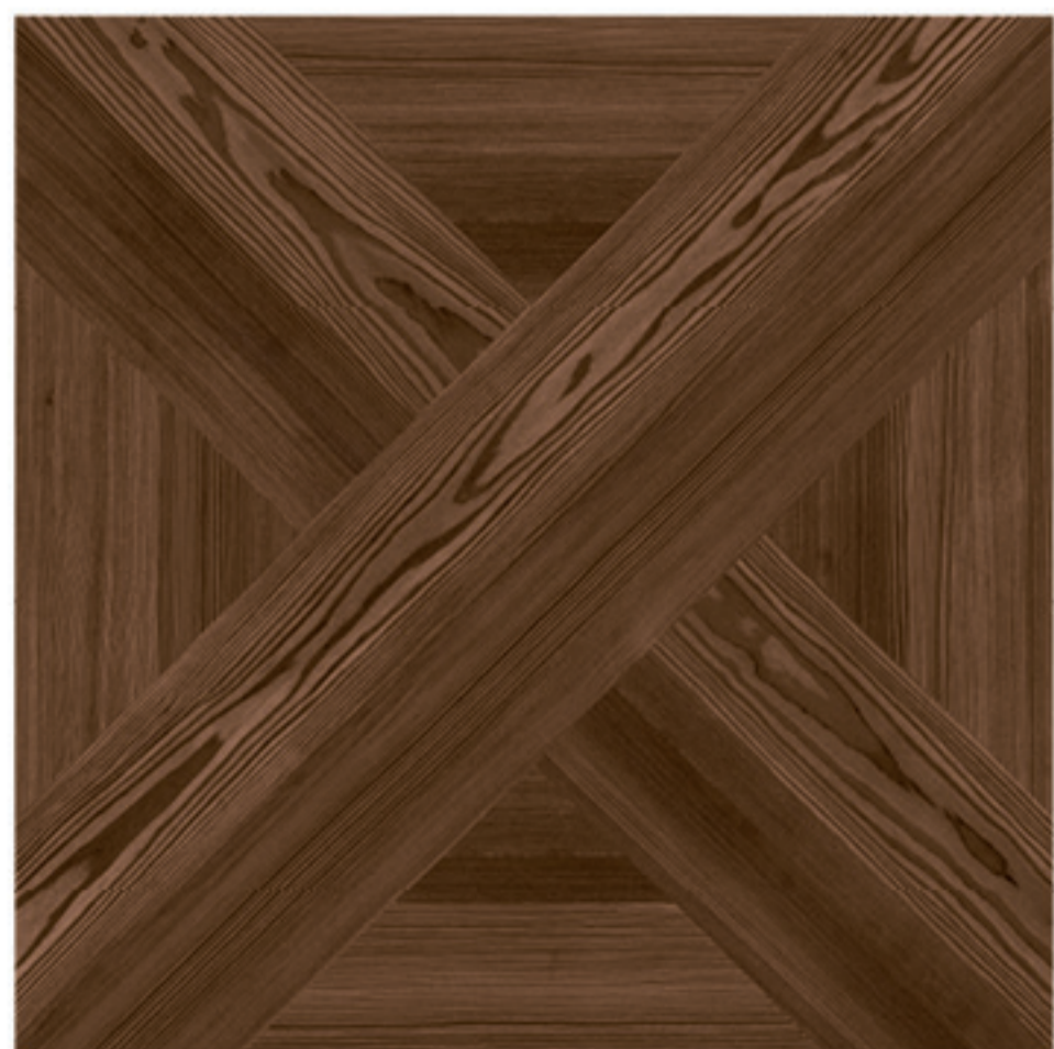
0424015 DECOR CHERRY 1/2/3/4 60x60