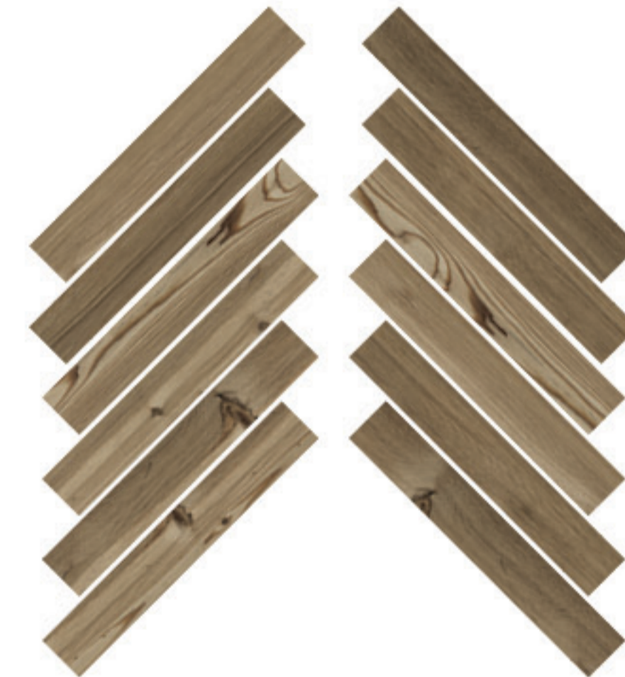
0424021 MOSAICO HERRINGBONE NOCCIOLA 28x59