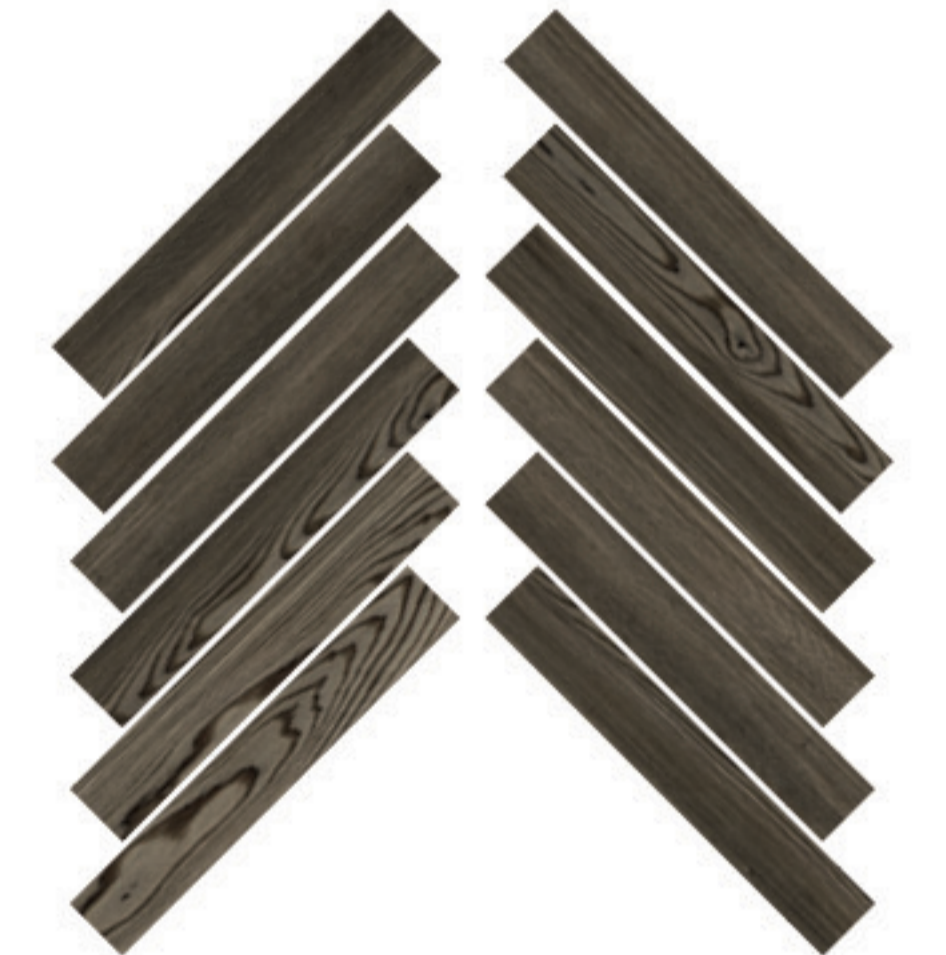
0424022 MOSAICO HERRINGBONE TABACCO 28x59