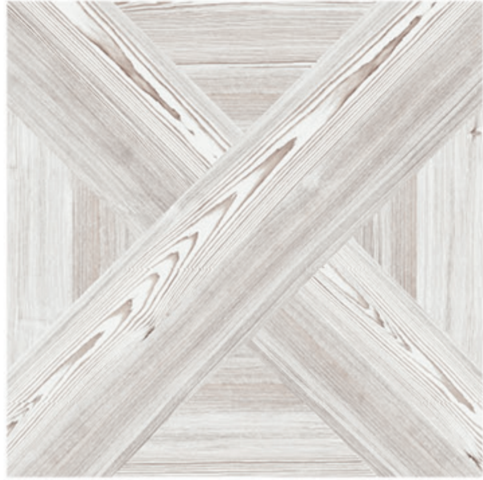
0424009 DECOR MANDORLA 1/2/3/4 60x60