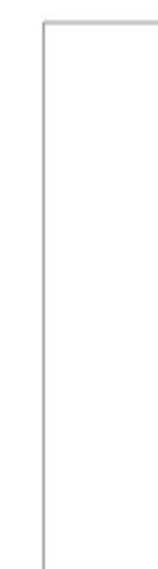
30x120 cm X 10 mm