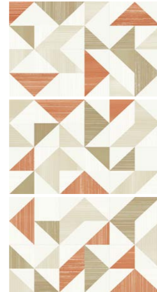
0417007 INSERTO ARANCIO 1/2/3 25x40

Abbinabile a / Matching with / Peut s'associer avec / Kombinierbar mit