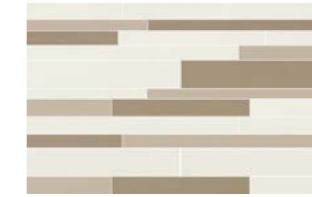
0417009 MURETTO MIX NOCCIOLA 25x40

Abbinabile a / Matching with / Peut s'associer avec / Kombinierbar mit