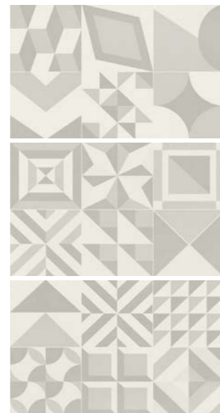
0417010 MARMETTE PERLA 1/2/3 25x40

Abbinabile a / Matching with / Peut s'associer avec / Kombinierbar mit