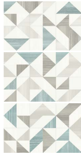
0417006 INSERTO SMERALDO 1/2/3 25x40

Abbinabile a / Matching with / Peut s'associer avec / Kombinierbar mit