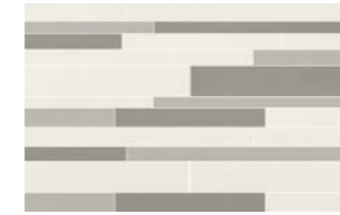
0417008 MURETTO MIX PERLA 25x40

Abbinabile a / Matching with / Peut s'associer avec / Kombinierbar mit