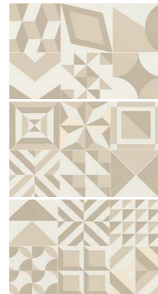
0417011 MARMETTE NOCCIOLA 1/2/3 25x40

Abbinabile a / Matching with / Peut s'associer avec / Kombinierbar mit