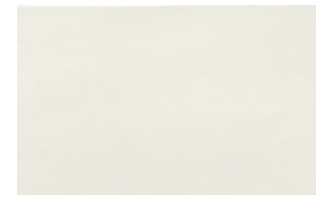
0417001 AVORIO 25x40